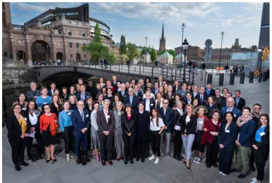
Die Teilnehmenden des 31. NEC-Forums