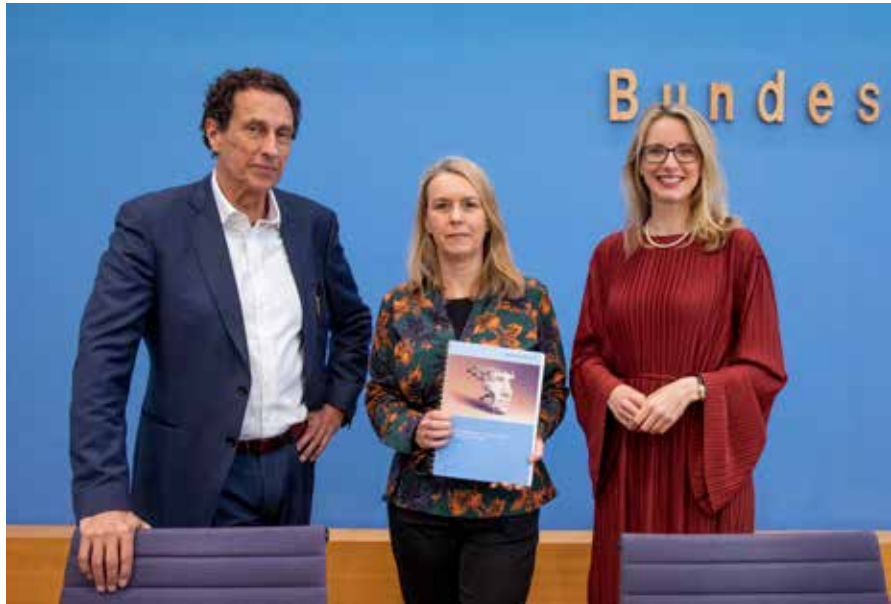
Die Ratsmitglieder Julian Nida-Rümelin und Judith Simon sowie die Vorsitzende des Deutschen Ethikrates Alena Buyx (v.l.) stellen die Stellungnahme „Mensch und Maschine“ in der Bundespressekonzferenz vor.

In der Schule sollte KI das Lernen unterstützen, aber nicht auf Kosten von sozialer Interaktion und auch nicht um den Preis von Überwachung oder Stigmatisierung von Lernenden. „Digitalisierung ist kein Selbstzweck;