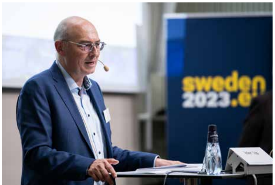
Volker Lipp, stellvertretender Vorsitzender des Deutschen Ethikrates, leitet das Panel zu „Gesundheit im Zusammenhang mit dem Klimawandel und Nachhaltigkeit“