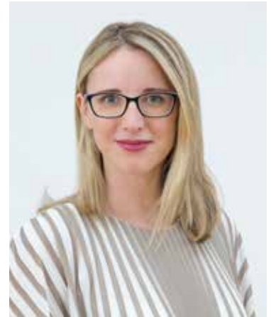
Alena Buyx Vorsitzende des Deutschen Ethikrates