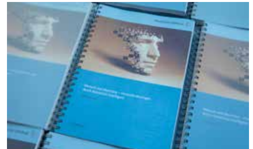
Stellungnahme „Mensch und Maschine – Herausforderungen durch Künstliche Intelligenz“